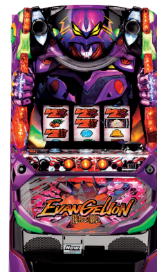
エヴァンゲリオン・勝利への願い