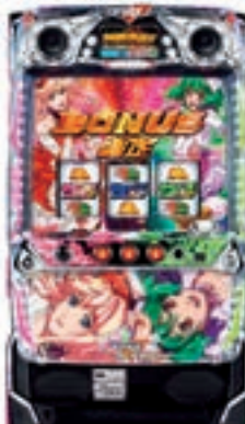
パチスロ マクロスフロンティア2 Bonus Live Ver. ©2009, 2011 ビックウエスト / 劇場版マクロスF製作委員会