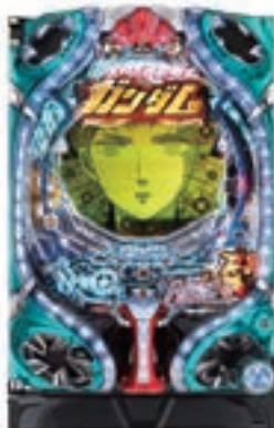
ファイバー機動戦士ガンダム-LAST SHOOTING-